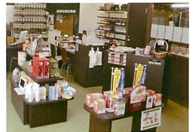
店内は広々と明るい雰囲気です