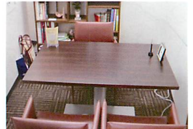
個室でゆったりとご相談

不妊で悩んでいる方が気軽にいらしていただけるよう4月に全面改装。個室も完備し、漢方相談歴30年の女性薬剤師がゆつくりと相談にのらせていただきます。ご予約で対応させていただきますが、いつでも気軽に立ち寄りください。